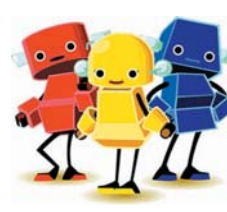
▲ ビジネスゲーム 「ロボロボ」