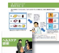
▲ eラーニング メンタルヘルスクエア (ライン、セルフ)