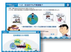
▲ eラーニング CSR教育