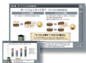
▲ 確定拠出年金教育 (シミュレーションゲーム付)

その他、専門コンサルティング会社、グローバルメーカー、保険会社、財団法人、小中学校等、業種・業態を問わず、さまざまな教育の現場でご活用いただいております。